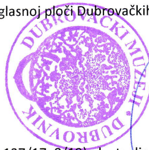
Ravnateljica Ivona Michl

Ova odluka stupa na snagu osmog dana od dana objave na oglasnoj ploči Dubrovačkih muzeja.